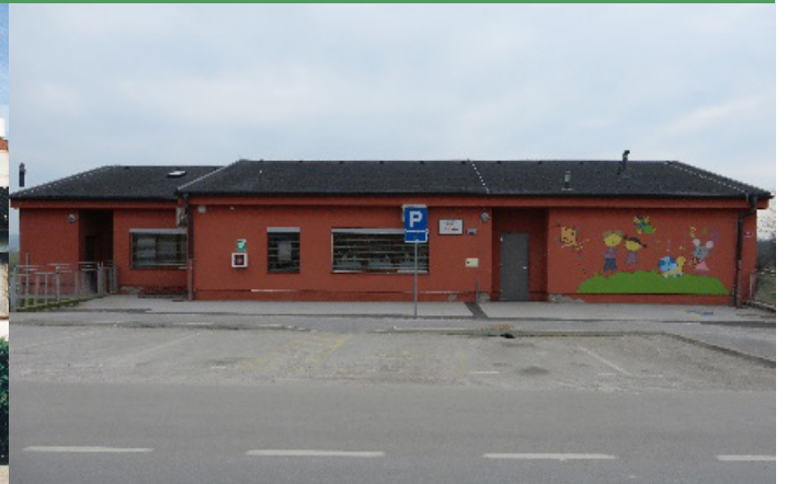
Otroški vrtec Ciciban Dobrovce