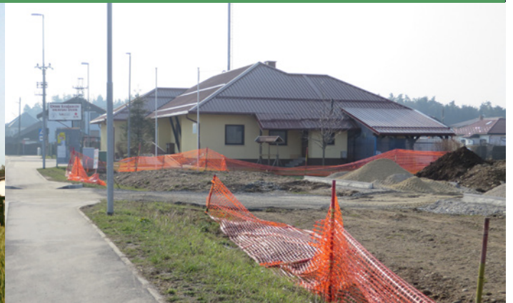
Središče Dravskega Dvora