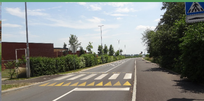
Pločnik Miklavž - Dobrovce