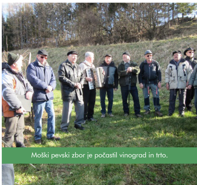
Moški pevski zbor je počastil vinograd in trto.