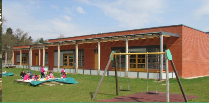
Otroški vrtec Ciciban Miklavž