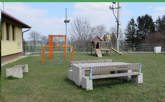
Otroško igrišče Dravski Dvor