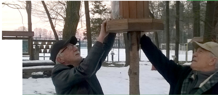
Ptičja krmilnica v Učnem parku Snežka

Šnežkin učni park, ki je v toplejšem delu leta dom številnih ptic, tudi v zimskih dneh nudi varno zavetje nekaterim vrstam ptic, ki se ne selijo v toplejše kraje. Zato so gobarski navdušenci to zimo še toliko skrbneje prinašali hrano v posebno ptičjo krmilnico, ki poleg 13 ptičjih valilnic izpopolnjuje gobarski park. Tudi do dvakrat na teden so s posebno ptičjo mešanico razveselili številne kose, siničke,