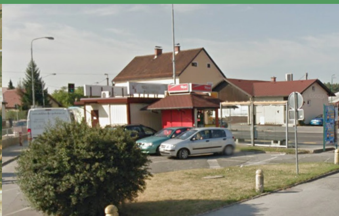
Otok v Ulici Kirbiševih