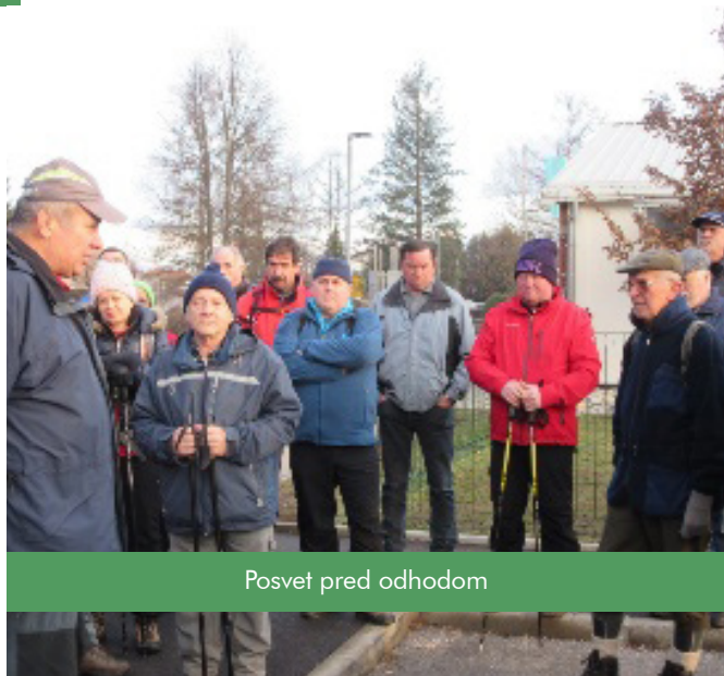
Posvet pred odhodom