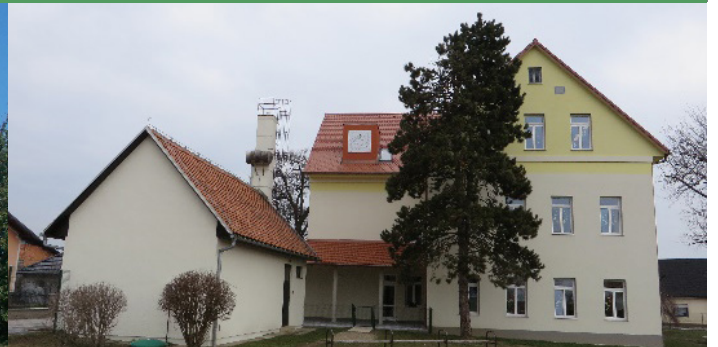
Podružnična šola Dobrovce