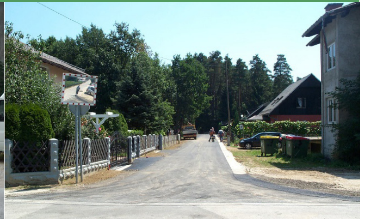
Asfaltiranje Ulice Paherjevih