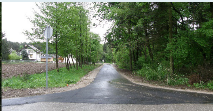
Ureditev povezave ob gozdu v Dravskem Dvoru