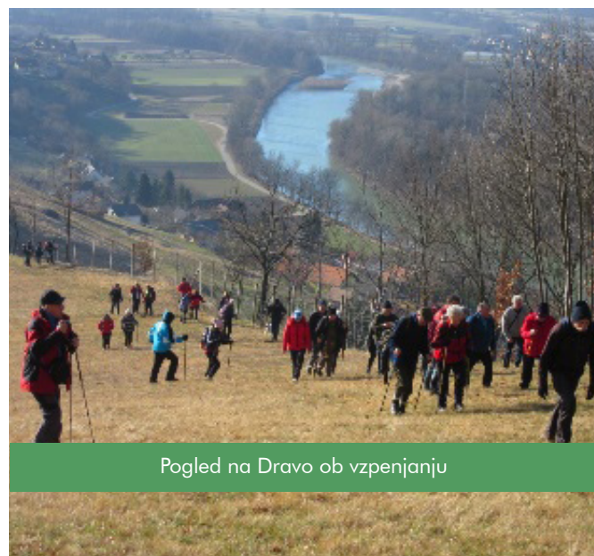
Pogled na Dravo ob vzpenjanju