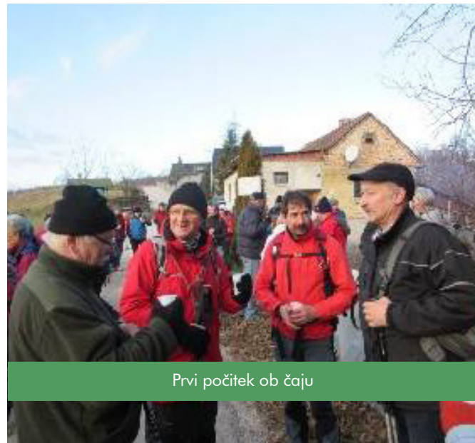
Prvi počitek ob čaju